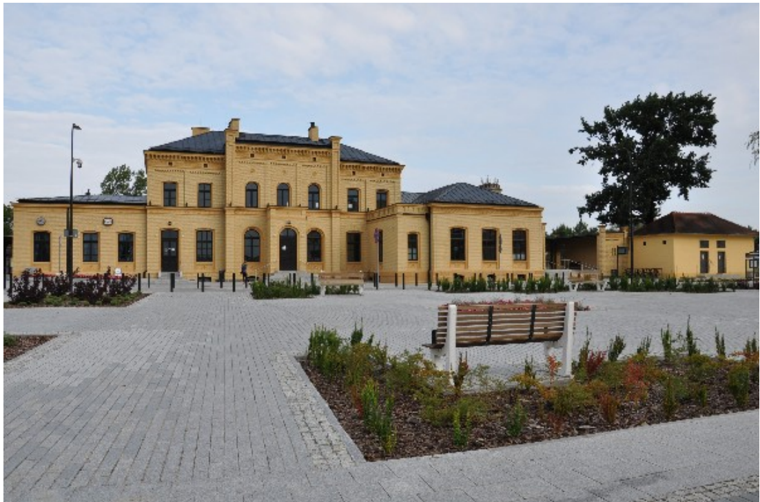
Zdjęcie nr 3: