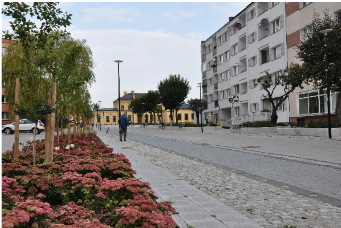
Zdjęcie nr 6: