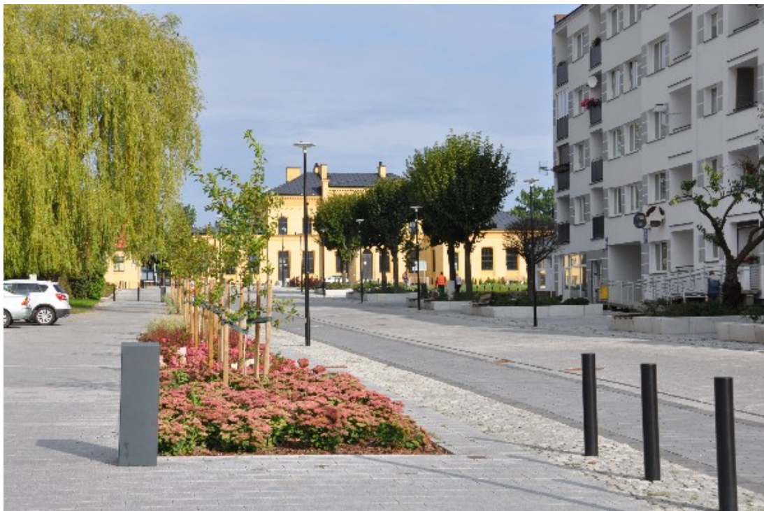
Zdjęcie nr 4: