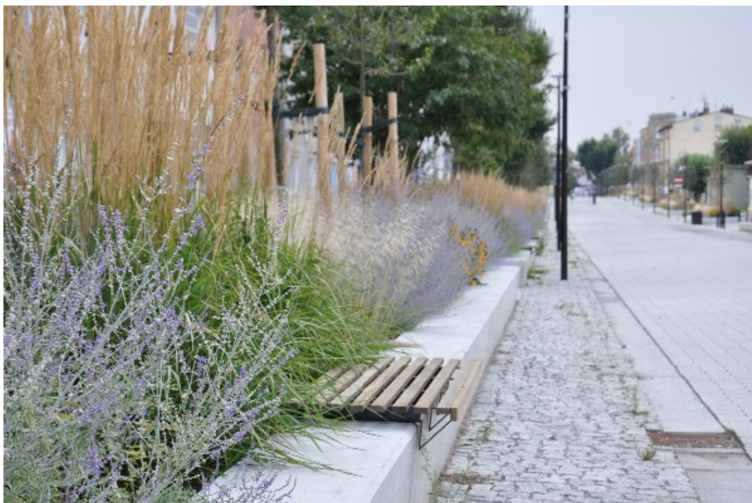
Zdjęcie nr 5: