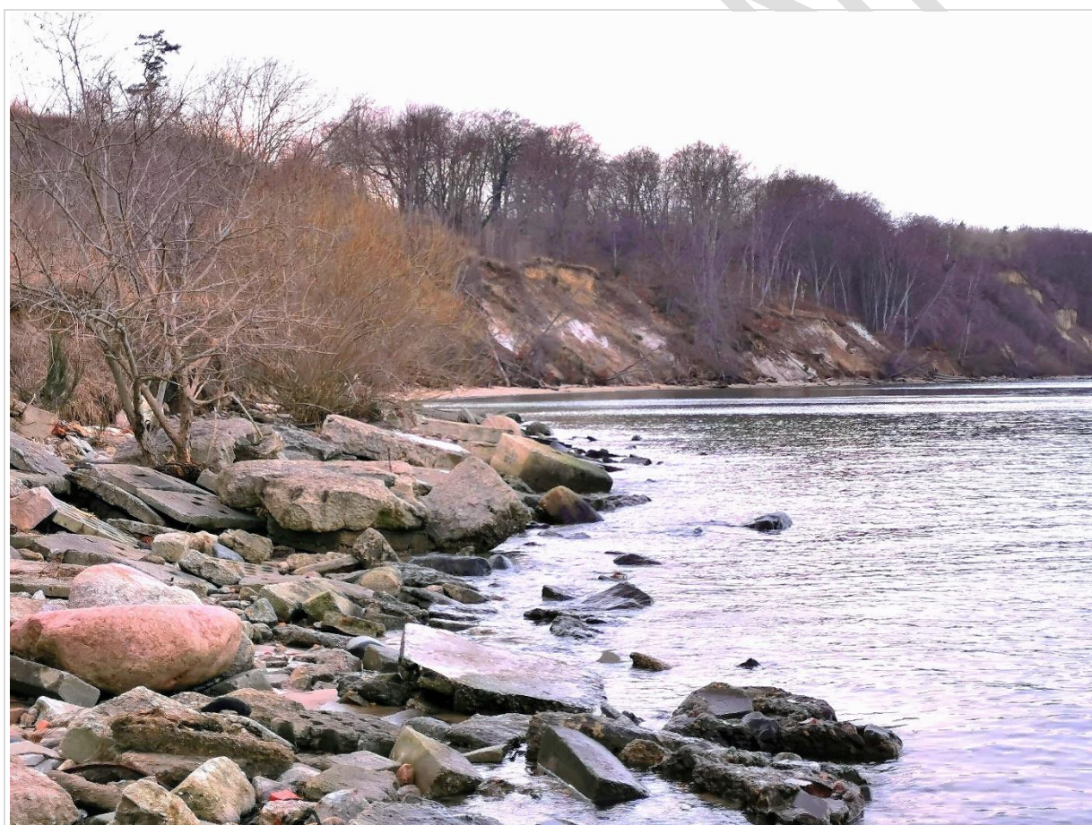
Fot. 1. Widok na północną część klifu Kępy Oksywskiej w rejonie Mechelinek

Krajobraz priorytetowy Wybrzeże klifowe Kępy Oksywskiej stanowi cenny pod względem przyrodniczo-krajobrazowym, częściowo aktywny, a częściowo porośnięty lasem fragment wybrzeża klifowego, o wysokości sięgającej do 40 metrów i długości około 2 kilometrów. U jego podnóża, w południowej części, rozciąga się rzadko spotykana na polskim wybrzeżu plaża kamienista, zbudowana z różnej wielkości oraz rodzaju kamieni i głazów, będących pochodzących z wychodnią warstwy tak zwanego bruku lodowcowego. W części północnej kamienista plaża przechodzi w piaszczystą, a klif całkowicie lub w części pozbawiony jest roślinności. Osobliwością warstw geologicznych odsłoniętego klifu jest występowanie piasków mioceńskich gęsto przebarwionych pyłem węgla brunatnego. Klif objęty jest ochroną w postaci stanowiska dokumentacyjnego przyrody nieożywionej. Celem ochrony krajobrazu jest zachowanie unikatowego fragmentu wybrzeża o wysokich walorach krajobrazowych i unikatowych zjawiskach geologicznych.