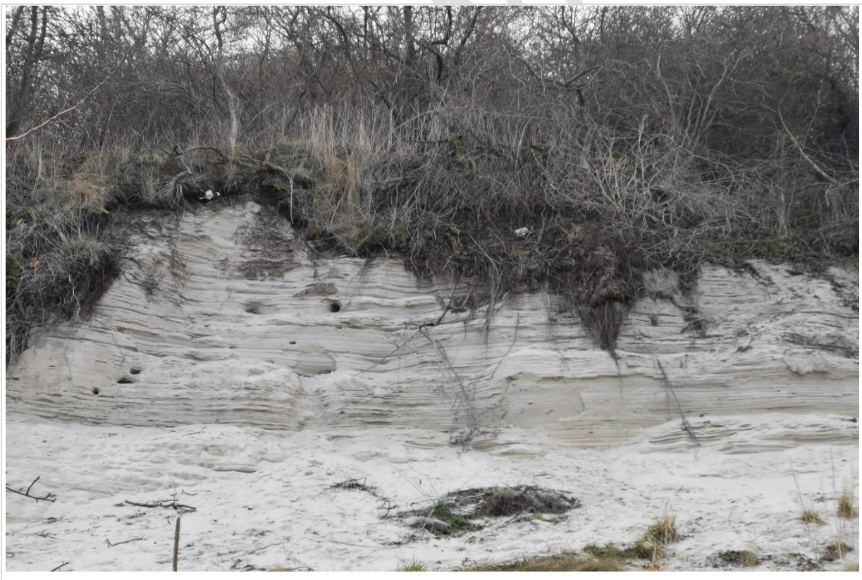
Fot. 2. Widok na aktywną krawędź abrazyjną klifu – w rejonie Oksywia, z warstwowaniem polodowcowych utworów piaszczysto-gliniastych

***** wypełnia się obligatoryjnie w ramach kolejnych audytów krajobrazowych