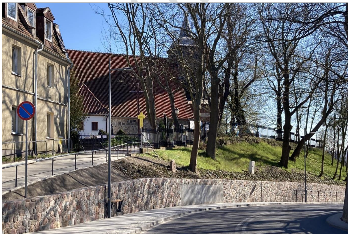
Fot. 7. Widok na kościół usytuowany ponad ulicą Arciszewskich

Najważniejszym spośród elementów materialnego dziedzictwa zlokalizowanych w obrębie jednostki krajobrazowej jest średniowieczny kościół Michała Archanioła usytuowany na skraju Kępy Oksywskiej, w sąsiedztwie którego na stromo opadającym stoku krawędzi wysoczyzny znajduje się niewielki cmentarz parafialny. Kościół mieści się ponad prowadzącą w jego kierunku ulicą Arciszewskich, stanowiąc część objętego wpisem do rejestru zabytków układu ruralistycznego dawnej wsi Oksywie. Budynek kościoła posadowiony został na kamiennym fundamencie na planie prostokąta, do którego od strony północnej przylega niewielka zakrystia (fot. 7.). Zwarta bryła obejmująca nawę oraz prezbiterium kryta jest rozległym dachem, do którego od strony zachodniej przylega wysoka wieża usytuowana na kamiennie-ceglanej kruchcie zwieńczonej drewnianą konstrukcją stanowiącą charakterystyczny punkt panoramy Oksywia.