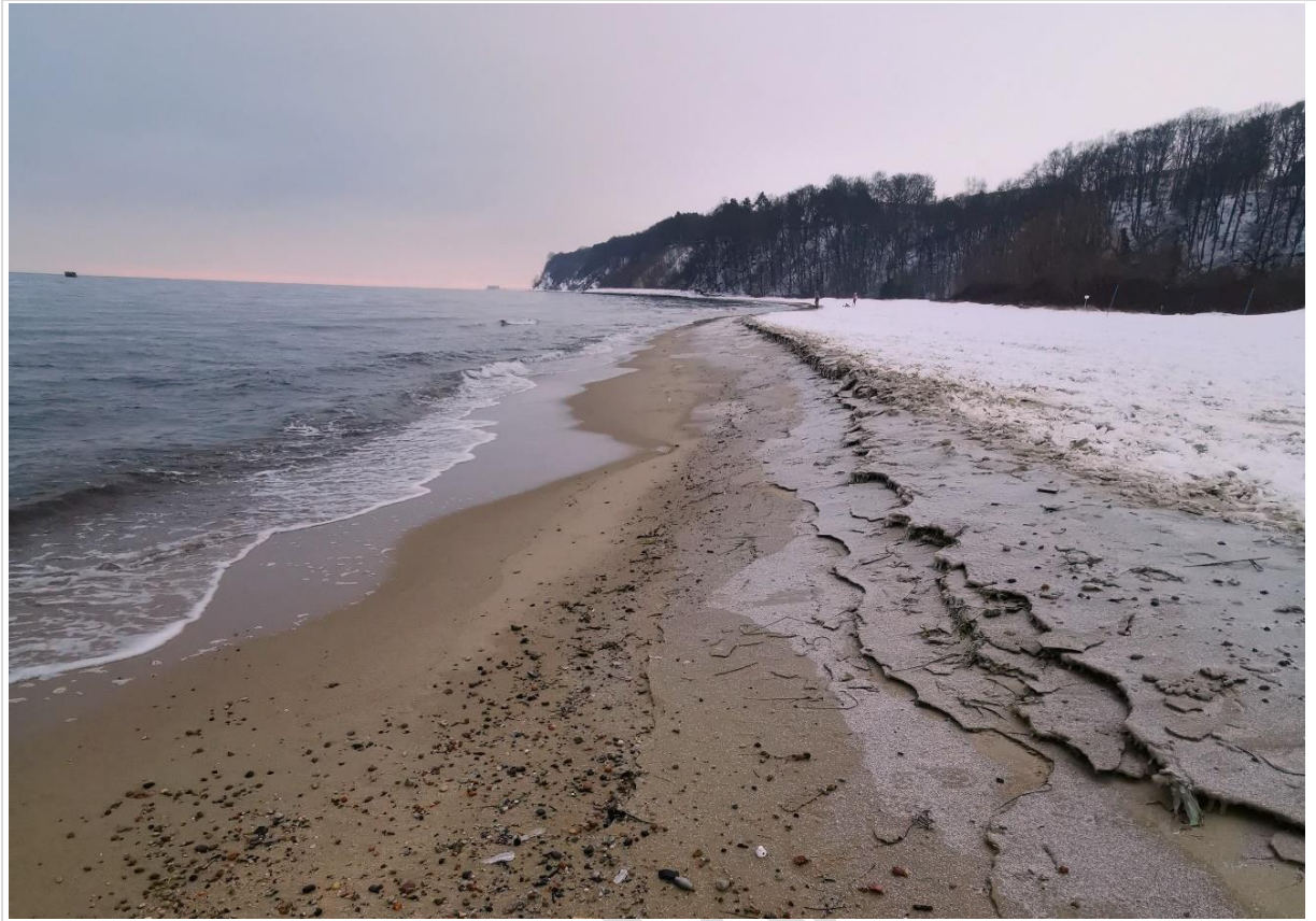
Fot. 1. Widok na południową część klifu Kępy Oksywskiej w rejonie Babich Dołów