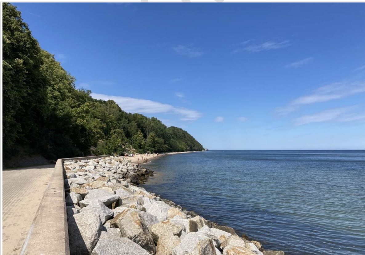
Fot. 2.; Betonowa opaska brzegowa w południowej części krajobrazu